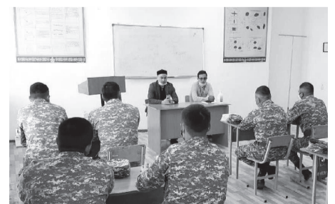
«Приозерск қаласының ішкі саясат, мәдениет және тілдерді дамыту бөлімі»

Кездесуге жал-пы 150-ге жуық адам қамтылды.