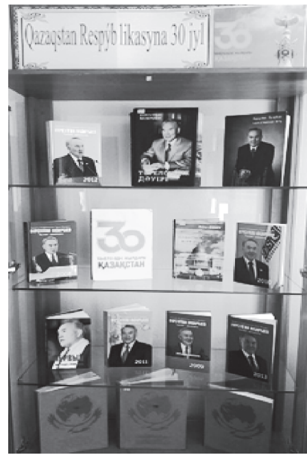
бағындырған биігі, жеткен жетістігі, дербес ел ретінде іргесін бекітіп, керегесін

Ұлт еркіндігі, ел егемендігі туралы сөз болғанда ең алдымен, ойға Тұңғыш Президентіміздің ерен тұлғасы оралады. Өйткені Тәуелсіздік пен Елбасы – егіз ұғым. Шын мәнінде, Қазақстанның 30 жылда бағындырған биіктері мен белестері Нұрсұлтан Әбішұлы Назарбаевтың көрген саясаты мен батыл бастамаларының нәтижесі. Жалпы, еліміздің бүгінгі қол артқан табысы,