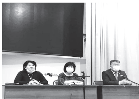
цинациялау процесіне қаламыздағы мектептердің 11-сынып оқушылары мен ата-ана-

лары, мектеп мұғалімдері бірлесе ат салысты. Өз кезегінде орталық аурухана дәрігерлері балаларды екпе алуға дейінгі тексеруден мұқият өткізіп, әр балаға жеке-жеке көңіл бөлді. Вакцина алғаннан кейін де денсаулық көрсеткіштерін өлшеп, жарты сағат көлемінде қатан бақылауда ұстады. Екпе алған барлық оқушылар жағдайларының жақсы екендіктерін айтып, басқа сыныптастарына да қорықпай, вакцина алуға, індетпен бірге күресуге кеңес беретіндіктерін жеткізді. Сонымен қатар екпе алу бойынша ақпараттық-түсіндірме жұмыстары да қарқынды түрде жүргізіліп жатыр. 24 қараша күні "Достық" балалар мен жасөспірімдер шығар-