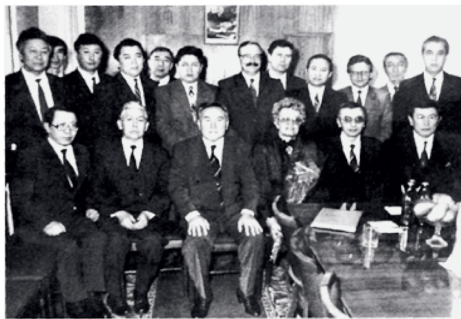
Президент қабылдауында Конституциялық Соттың судьялары 1994

Теміртауға келген соң, олардың арасынан 120 адамды іріктеп Магниторскіге оқуға жіберді. Оқу аяқталар тұста әлгілерден