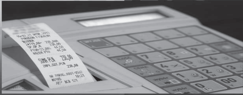
БАҚЫЛАУ КАССА МАШИНАСЫ КОНТРОЛЬНО-КАССОВАЯ МАШИНА