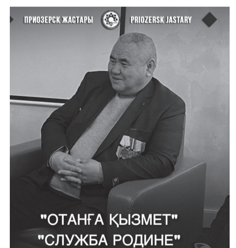
"ОТАНҒА ҚЫЗМЕТ" "СЛУЖБА РОДИНЕ"

9 февраля 2023 года молодежным ресурсным центром города Приозерск в центре “Coworking Zone” в целях патриотического воспитания молодежи была организована встреча с “ветеранами Афганистана”.