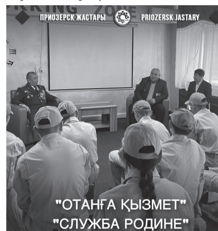
"ОТАНҒА ҚЫЗМЕТ" "СЛУЖБА РОДИНЕ"

Кездесудің басты мақсаты – Ауған соғысы ардагерлеріне құрмет көрсету, патриоттық рухы жоғары, қайсар жауынгер ағалардың ерлігін үлгі ету, есімдерін кәсірлеу болып табылады.