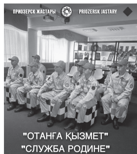
"ОТАНҒА ҚЫЗМЕТ" "СЛУЖБА РОДИНЕ"

Кездесудің басты мақсаты – Ауған соғысы ардагерлеріне құрмет көрсету, патриоттық рухы жоғары, қайсар жауынгер ағалардың ерлігін үлгі ету, есімдерін кәсірлеу болып табылады.