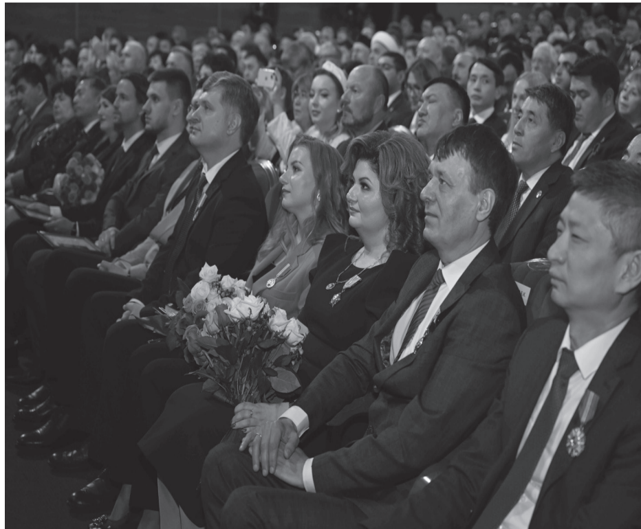
Мемлекет басшысы Тәу мәдениет қайраткерлерімізді,

Президент Қасым-Жомарт Тоқаев өз сөзінде Қазақстан халқы Ассамблеясының XXXII сессиясынан бері елімізде түбегейлі өзгерістер болғанын атап өтті. Атап айтқанда, саяси жүйе жүйелі түрде трансформацияланды, мемлекеттік құрылымның жаңа әрі анағұрлым демократиялық үлгісі қалыптасты. Ауқымды өзгерістер барысында Ассамблеяға баса мән берілді. Аталған бірегей институт парламенттік өкілдіктің жаңа тетіктеріне ие болды. Президент Ассамблеяның елімізді саяси тұрғыда жаңғыртып, жалпыұлттық тұтастықты нығайту ісінде маңызды рөл атқарғанына назар аударды. ҚХА барлық этносты мемлекетті дамытудың стратегиялық міндеттерін шешу ісіне жұмылдыруға ықпал етті.