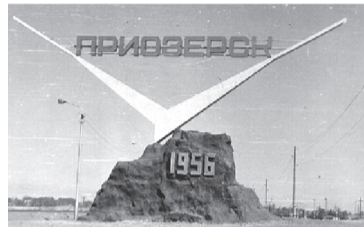
1 – маршрут «Военный город Приозерск» (по следам «холодной войны»); Учения Вооруженных Сил МО Республики Казахстан

Наш город предоставлен проектами 3-х туристических маршрутов: