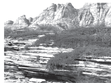
3 – маршрут «Духовная Бетпак – Дала» (паломнический тур); Государственный заказник «Бектаута»

Организаторами и партнерами конкурса «Сары-Арка туристическая-2015» являются: Палата предпринимателей Карагандинской области, областное управление