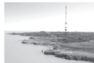
2 – маршрут «Пляжный Приозерск» (спортивно-оздоровительный); Парусная регата. Санаторий «Балхаш».

дальнейшего продвижения. Планируется выпуск туристических