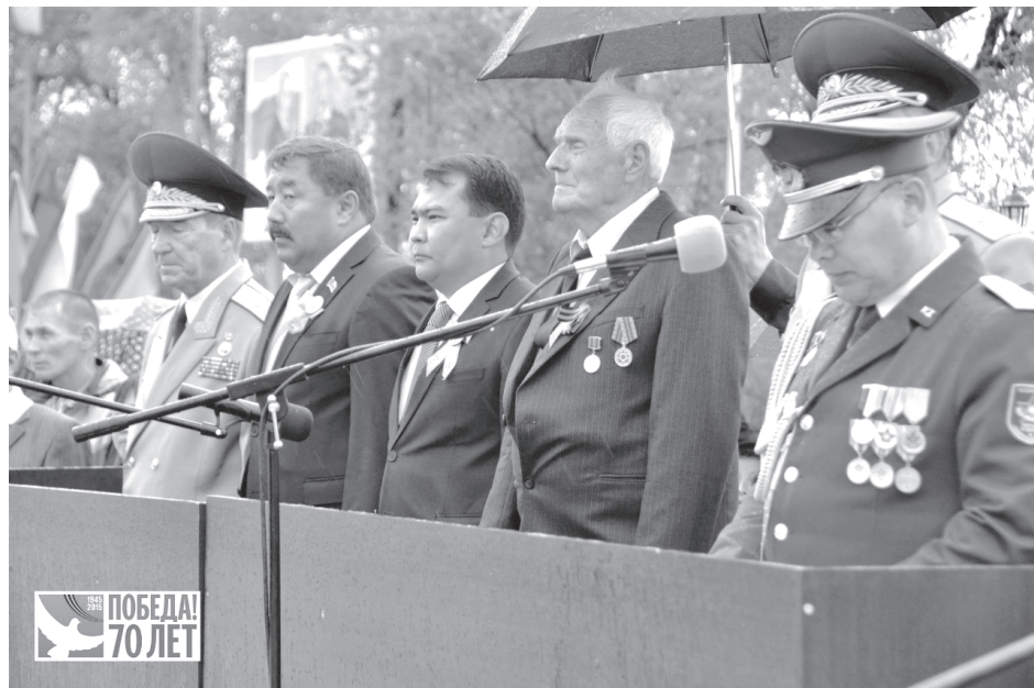
шук Маметовой, Толегена Токтарова, Нуркена Абдирова и других отважных героев войны. Их великий подвиг навсегда вписан с Историю, он всегда

Не малую лепту в общее дело приближения Великой Победы внес и Казахстан. Из Казахстана на фронт было направлено 12 стрелковых дивизий, 4 национальные кавалерийские дивизии, 7 стрелковых бригад, в том числе 2 национальные стрелковые бригады. Кроме того, в Казахстане было сформировано около 50 полков и батальонов различных видов войск. В годы войны 500 казахстанцев стали Героями Советского Союза, более 100 - полными кавалерами ордена Славы, четверо были дважды удостоены звания Героя Советского Союза. Это - Талгат Бегельдинов, Леонид Беда, Иван Павлов