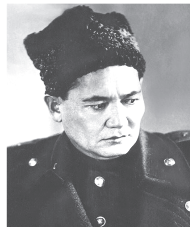
«Тәртіпсіз ел болмас, тәртіпке бағынған құл болмас» Бауыржан Момышұлы

ға жүктелген міндеттер жалпы сот жұмысын одан әрі дамытып, судьялардың өздеріне жүктелген міндеттерді терең сезіп, адам дағдырына аса жоғары жауаптылықпен қарап, әділ шешім қабылдауына ықпал етіп, қорыта айтқанда қарапайым халықтың сотқа деген сенімін қалыптастырады.