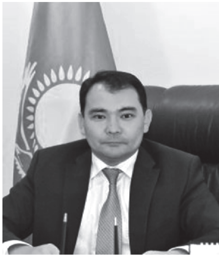
Құрметті қала тұрғындары! Уважаемые жители города!

Өткен 2018 жыл Қазақстан Республикасы Рәміздерінің 25 жылдығы, Астанамыздың 20 жылдығы және Бұхар жыраудың 350 жылдығы сияқты айтулы даталар мен ел өміріндегі маңызды оқиғаларға толы.