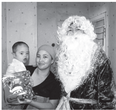
Жұмыспен қамту және әлеуметтік бағдарламалар бөлімі

Акция аясында мүмкіндігі шектеулі 42 баланы, сондай-ақ демеушілік қаражат есебінен 16 қамтылған отбасынан шыққан 16 баланы Аяз ата жаңа жыл мерекесімен құттықтап, тәтті сыйлықтар таратты. Балалар сыйлықтармен бірге 2019 жылға жетерлік жақсы әсер алды деген үміттеміз.