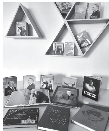
жаңулық бақыт, сәулеті ғұмыр тілейміз! «Приозерск қалалық кітапханасы» КММ

Халық алдында, мемлекет алдында осындай толағай тірлік атқарған Елбасын - туылған күнімен шын жүректен құттықтаймыз.«Елі еріне, ері еліне» сенген еліміз бен Елбасымыздың мәртебесі әлем елдері алдында мәңгілік биіктей берсін! Сзге