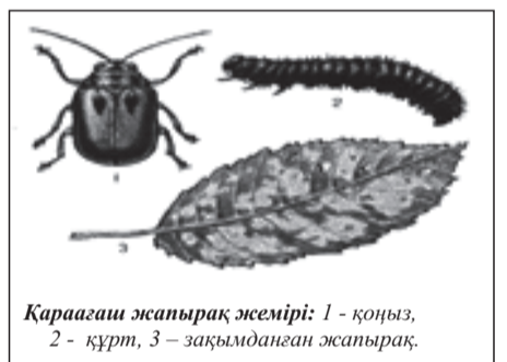
Қараағаш жапырақ жемірі: 1 - қоңыз, 2 - құрт, 3 - зақымданған жапырақ.

Қараағаш жапырақ жемірі [Pyrrhalta (Galerucella) luteola], Еуразияда, Батыс Ресейде, орталық Азияда, Қазақстанда көп тараған. Қоңыздың ұзындығы 5-8 мм, сопақша келген қоңыр сары түсті қоңыз. Аталған қоңыз әдетте жылына екі, орта Азияда, Қазақстанда үш ұрпақ береді. Ең зияндысы бірінші ұрпақтары. Аталған зиянкестер (қоңыздар) бірінші жұмырқаларын мамыр айының бірінші онкүндігінде жаңа жапырақ астына жұмыртқалап (бір жетілген қоңыз 400-700 дана жұмыртқа салады) және сол жерде жұмыртқа мамыр айының ортасында жұмыртқа салғаннан кейін екі апта өткенде құртқа айналып, құрттар жаңа жапырақтарды жей бастайды. Қараағаш жапырақ жемірі зиянкестерінің екінші ұрпақтары жетілгенде қараағаштардың барлық жапырақтары зақымданады. Ағаштардың өсуі тоқтап, қурап, солуға дейін әкеледі. Ағаш зиянкестерінің көбею себептерінің бірі - қураған ағаштар мен бұталардың дер кезінде кесілмеуі. Қураған ағаштардың қабығының асты жетілген қоңыздардың қыстау ұясы болып табылады. Сондықтан қураған ағаштарды, бұталарды кесіп өртеу, сондай-ақ ағаштардың түбін қопсытып,