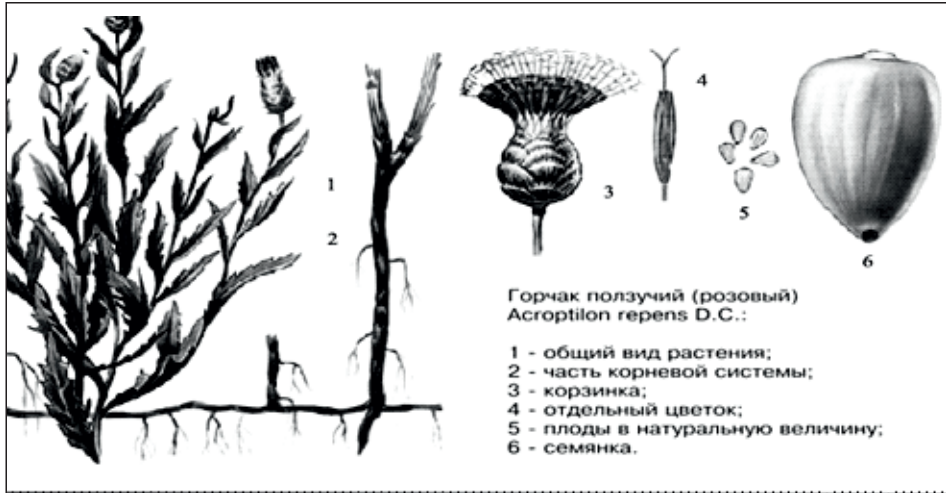
Горчак ползучий (розовый) Ascorptilon gerens D.C. :