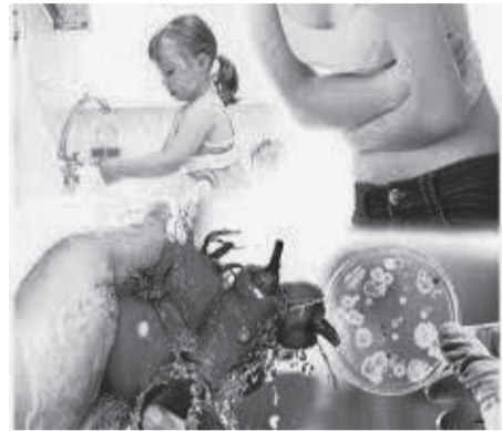
Приозерск қаласының санитариялық-эпидемиологиялық бақылау басқармасы.

туындайды. Осындай қарапайым ережемен сіз өзіңізді де және отбасы мүшелерін де әртүрлі инфекциялардан қорғай аласыз.