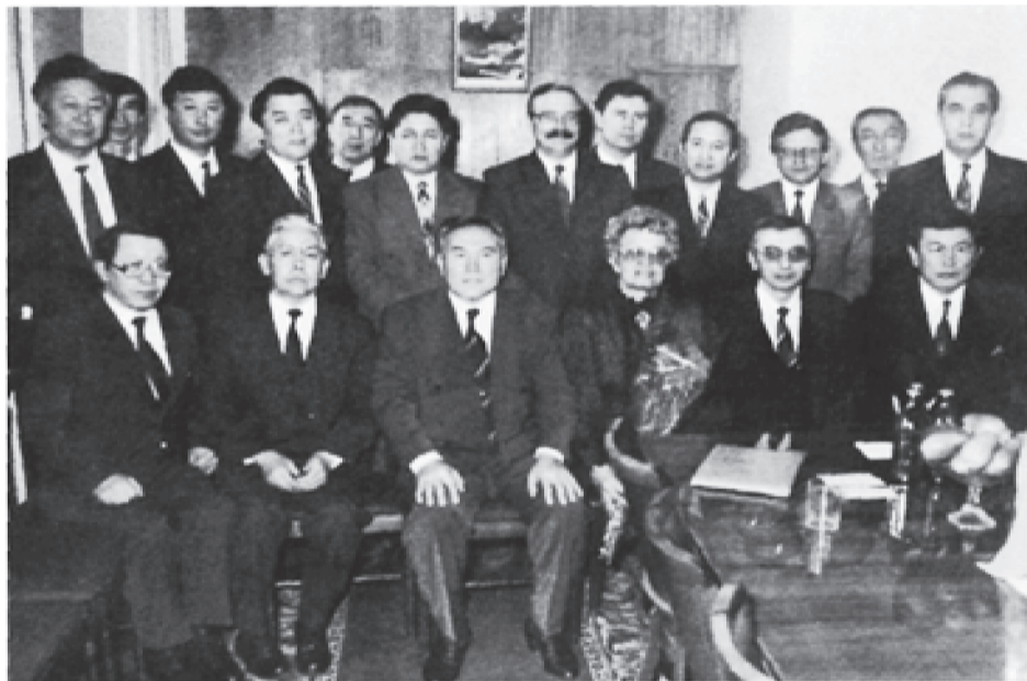
Президент қабылдауында Конституциялық Соттың судьялары 1994

Ел аузындағы тарихи деректер мен аңыз-әңгімелер, сондай-ақ ата-бабаларымыздың ұлағаттары сөздері, өлең-жырлары және мұрағат қорлары да кеңінен пайдалынған. Кітап мазмұны тек өмірбаянмен ғана шектелмейді, онда Қазақстан тарихына қа-