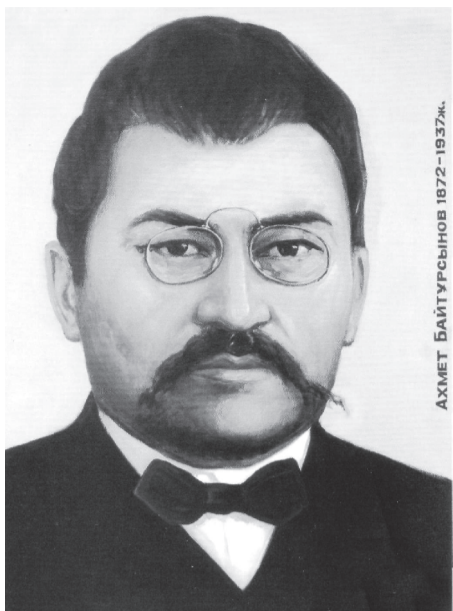
АХМЕТ БАЙТҰРСЫНҰЛЫ 1872-1937ж.

Биыл қазақ халқына ағартушы, ақын, алғашқы жазушылардың бірі және бірегейі, ұлт жанашыры, қоғам және мемлекет қайраткері ретінде танымал Ахмет Байтұрсынұлының туғанына 150 жыл. Қазақ ұлтының дербес һәм тәуелсіз ел болуына зор үлес қосқан қайраткер туралы «Приозерский вестник» газеті өзінің оқырмандары мен жас ұрпаққа габрият қалдыруды өзінің міндеті деп санайды.